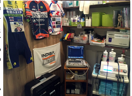
患者さんの「期待度」を高めるため、院内ではユニフォームやポスターなども積極利用